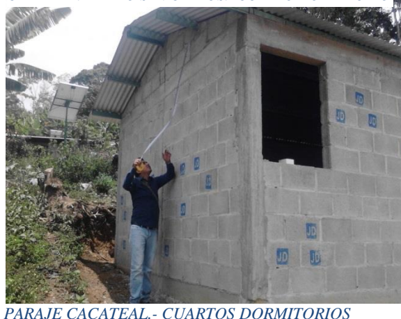
PARAJE CACATEAL.- CUARTOS DORMITORIOS