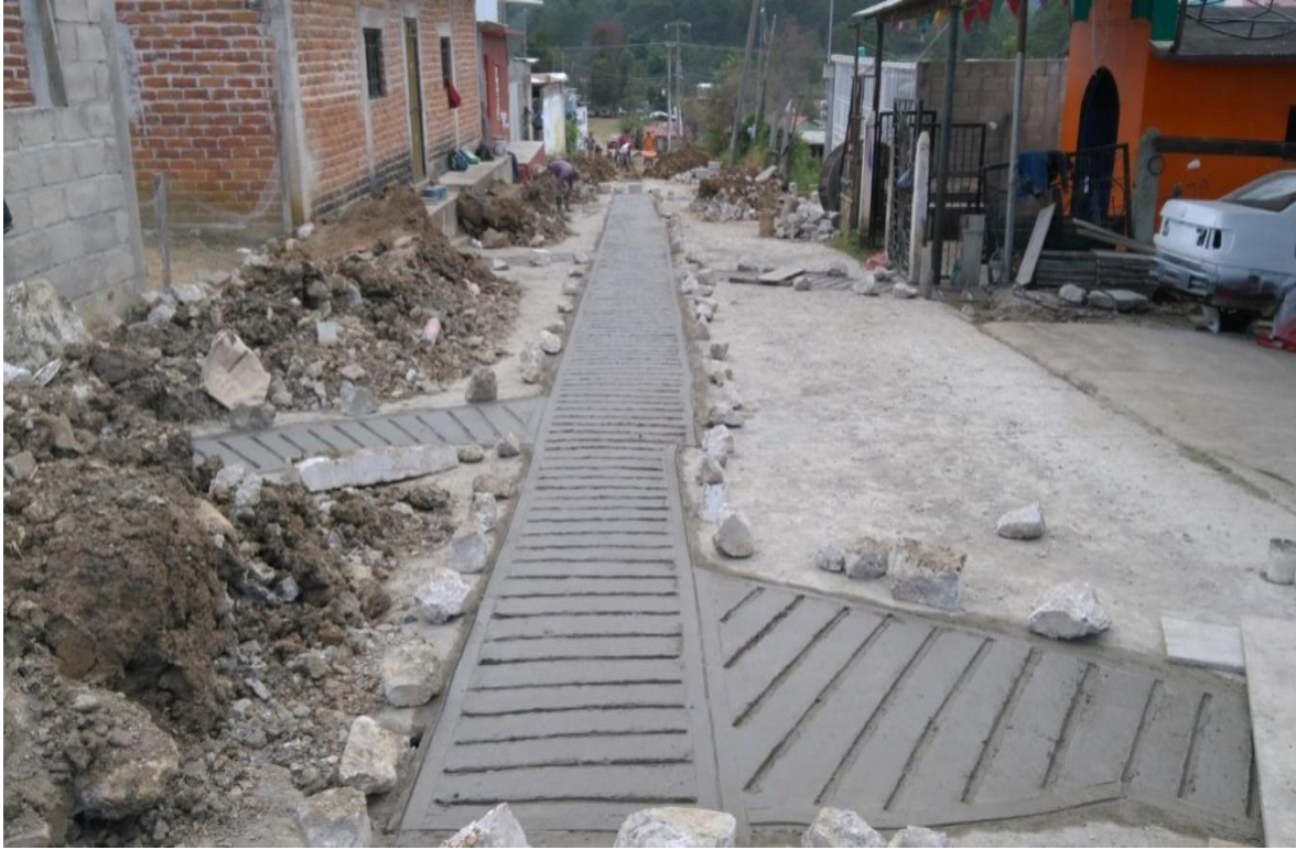
BARRIO SAN FRANCISCO

Pavimentación de Calles con Concreto Hidráulico , en Barrio Sr. del Pozo y Plan Paredón con un monto de $1,677,000.00 (Un millón seiscientos setenta y siete mil pesos M.N.).