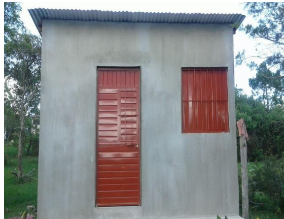
CAB MPAL. BARRIO SAN CARLOS.- CUARTO DORMITORIO