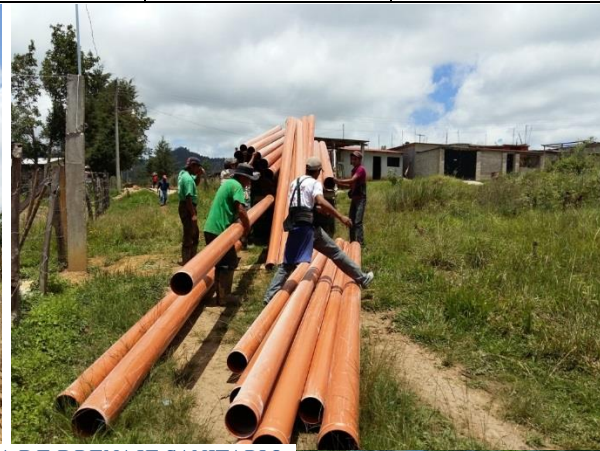
BENITO JUAREZ.- SISTEMA DE DRENAJE SANITARIO