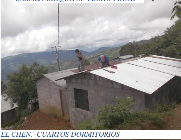
EL CHEN.- CUARTOS DORMITORIOS