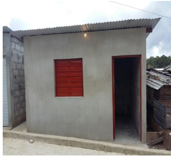
CAB MPAL BARRIO SAN PACUALITO.- CUARTOS DORMITORIOS

Rehabilitación de Drenaje Sanitario , con un monto de $1,515,000.00 (Un millón quinientos quince mil pesos M.N.), beneficiando al Barrio Sr. del Pozo, Paraje El Palmarcito, y Barrio San Francisco.