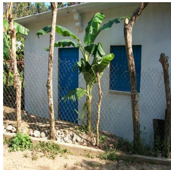
SANTA MARIA.- CUARTOS DORMITORIOS