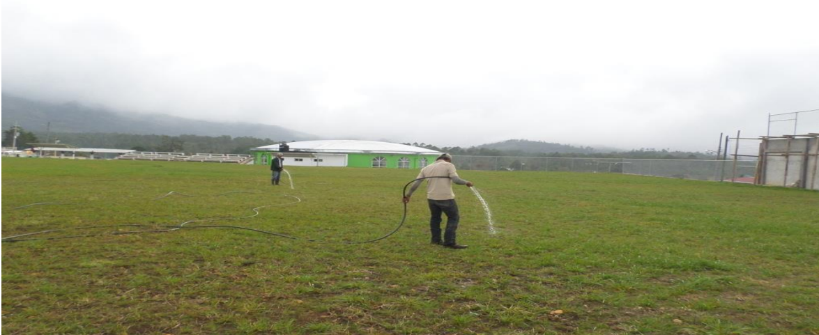
CAMPO DE FUTBOL "FRAY MANUEL PIÑA"

Rehabilitación del Campo Fray Manuel Piña , con un monto de $1,032,582.80 (Un millón treinta y dos mil quinientos ochenta y dos pesos 80/100 M.N.).