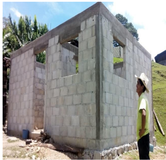
MADERITO.- MURO FIRME