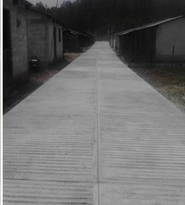
EL SALITRAL.- PAVIMENTACION DE CALLES