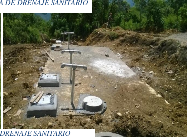
EL AMATE.- SISTEMA DE DRENAJE SANITARIO