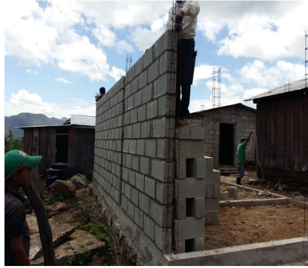
FRACC. 8 DE JUNIO.- CUARTO DORMITORIO