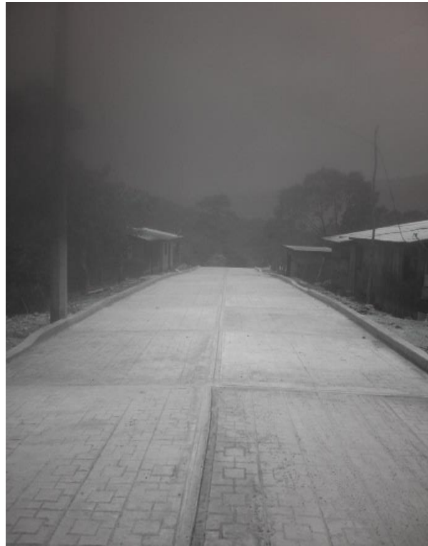
POBLADO LA LAGUNA.- PAVIMENTACION DE CALLES