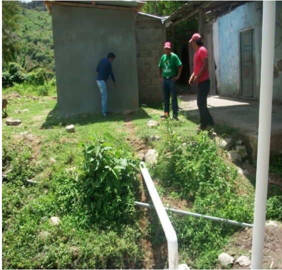
BARRIO SAN PASCUALITO.- CUARTO DORMITORIO