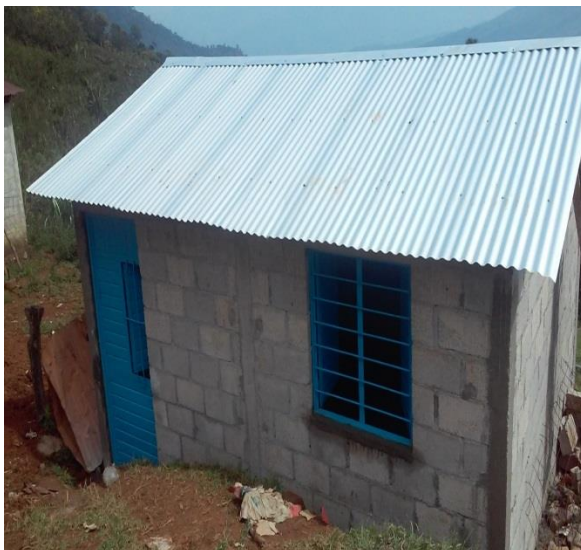
SAN JOSE.- CUARTOS DORMITORIOS