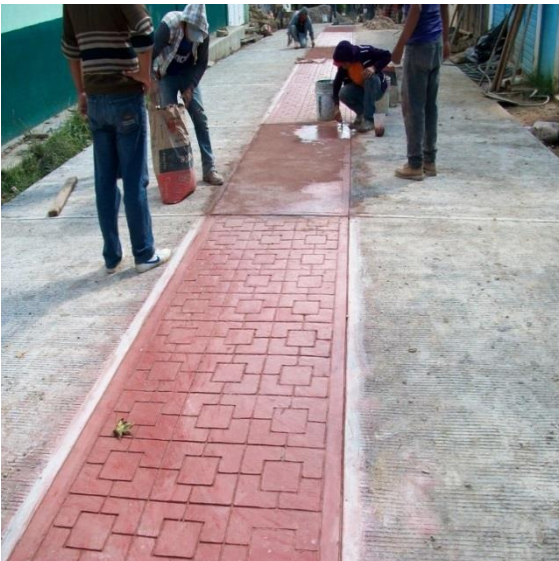
BARRIO SEÑOR DEL POZO

Pavimentación de Calles con Concreto Hidráulico , en Barrio Sr. del Pozo y Plan Paredón con un monto de $1,677,000.00 (Un millón seiscientos setenta y siete mil pesos M.N.).