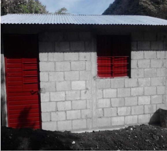
SACRAMENTO.- CUARTOS DORMITORIOS