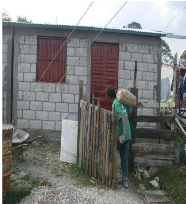
PAJAROS AZULES.- FOSA SÉPTICA