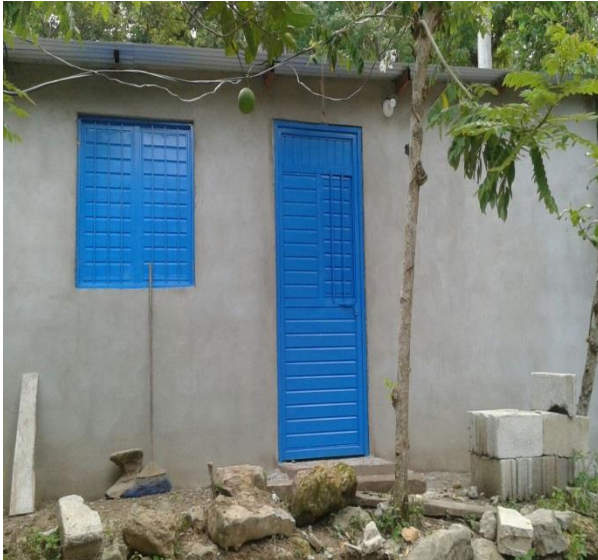
POBLADO EL PALMAR.- CUARTOS DORMITORIOS