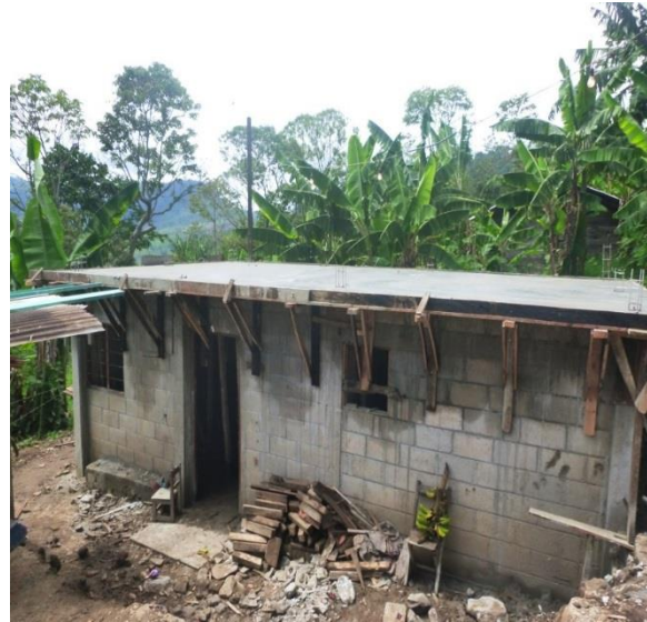
CAFETAL SOCORRO.- TECHO FIRME