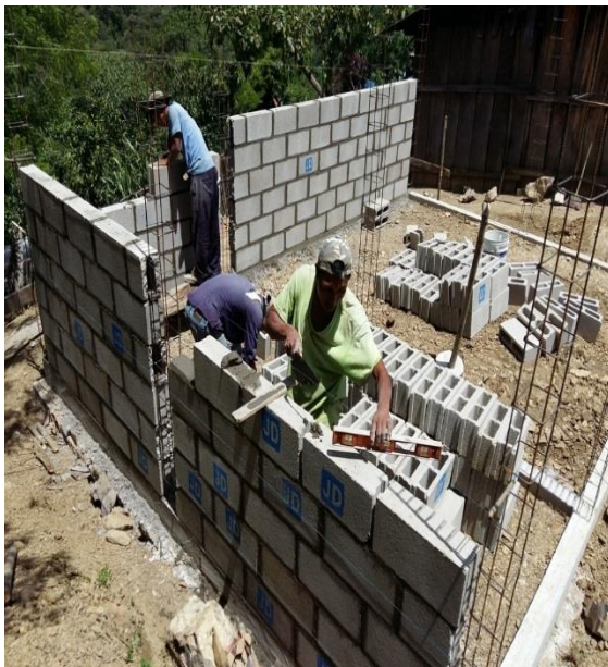
TRÁNSITO II.-BAÑOS CON FOSA SÉPTICA