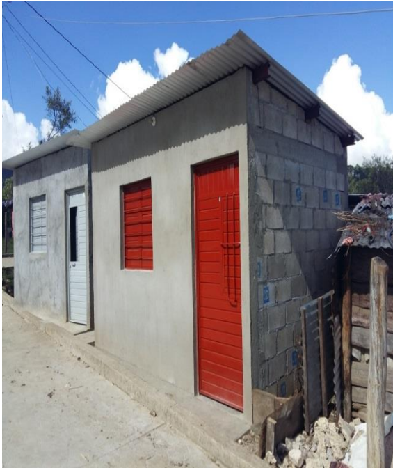
MATASANO.- CUARTO DORMITORIO