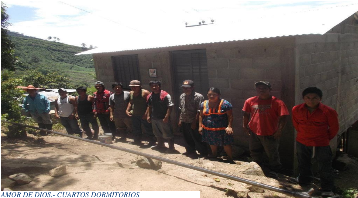
AMOR DE DIOS.- CUARTOS DORMITORIOS