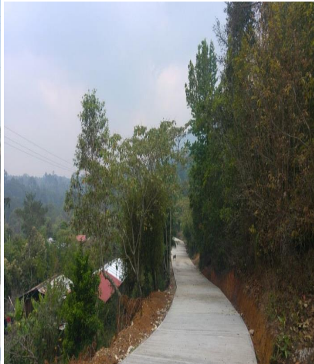
EL OCOTAL.- PAVIMENTACION DE CALLES